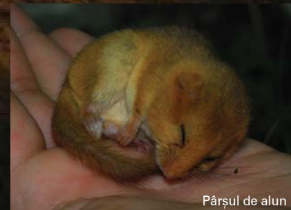
Pârșul de alun